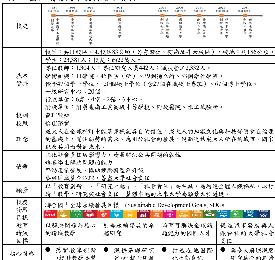
表 1 國立成功大學校務基本資料